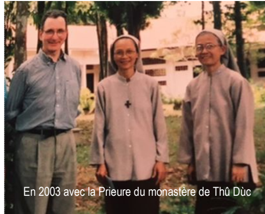
En 2003 avec la Prieure du monastère de Thù Dúc